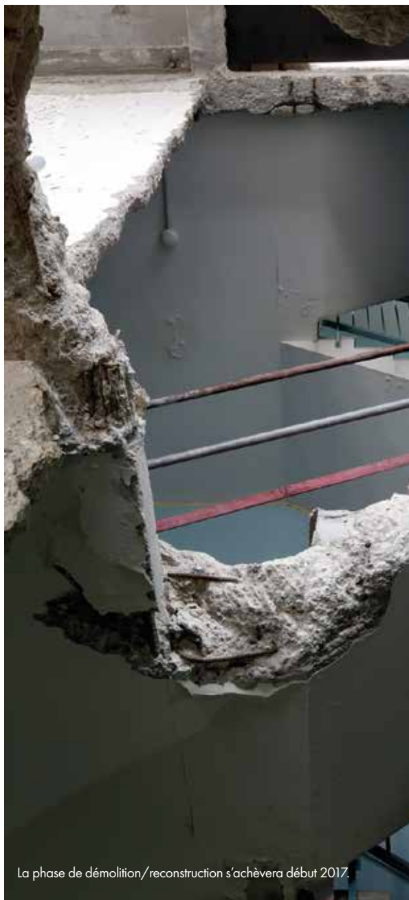
La phase de démolition/reconstruction s'achèvera début 2017.