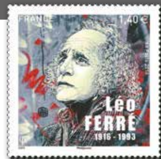
© Création C 215, d'après photo d'Hubert Grootenbois