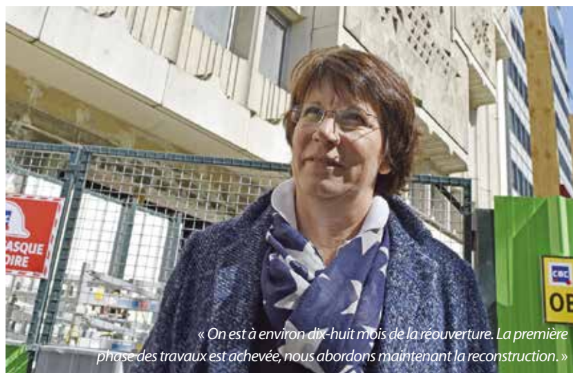
« On est à environ dix-huit mois de la réouverture. La première phase des travaux est achevée, nous abordons maintenant la reconstruction. »

tions culturelles ; les seniors, avec des spectacles et conférences organisées