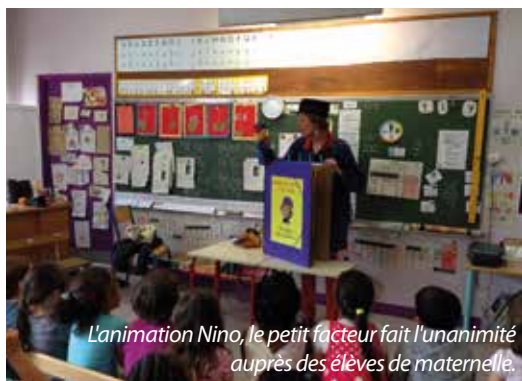
L'animation Nino, le petit facteur fait l'unanimité auprès des élèves de maternelle.

Conçue pour les élèves de maternelle, l'animation Nino le petit facteur a rencontré son public.