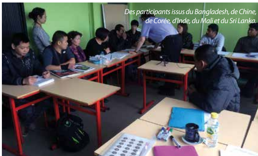
Des participants issus du Bangladesh, de Chine, de Corée, d'Inde, du Mali et du Sri Lanka.