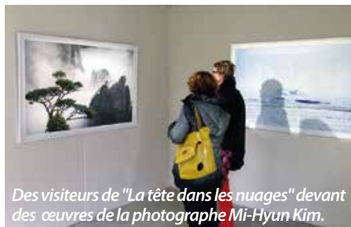
Des visiteurs de "La tête dans les nuages" devant des œuvres de la photographe Mi-Hyun Kim.

La tête dans les nuages, jusqu'au 18 mai, une exposition du Musée de La Poste - soutenue par Météo France - accueillie au Musée du Montparnasse, 21 avenue du Maine, Paris 15ème. Ouvert tous les jours (sauf le dimanche). Entrée libre.