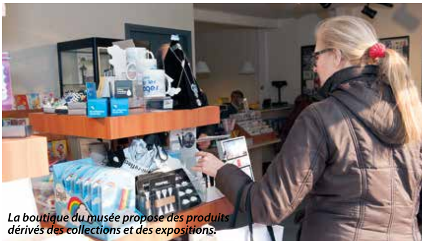
La boutique du musée propose des produits dérivés des collections et des expositions.

Pendant sa rénovation, le Musée de La Poste a choisi de déplacer sa boutique de quelques centaines de mètres. Un changement d'habitude auquel les clients se font chaque jour un peu plus.