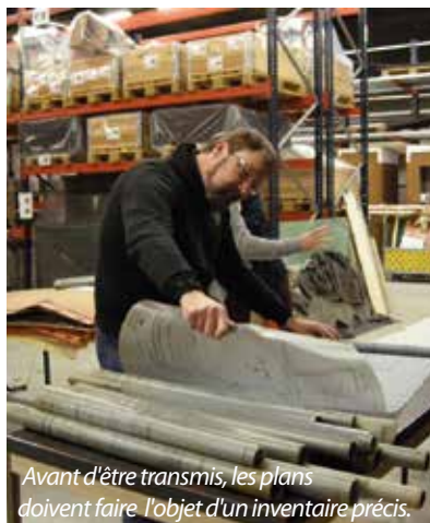
Avant d'être transmis, les plans doivent faire l'objet d'un inventaire précis.

Autre condition au transfert : le diagnostic « amiante ». Praticué récemment, il a révélé que les documents