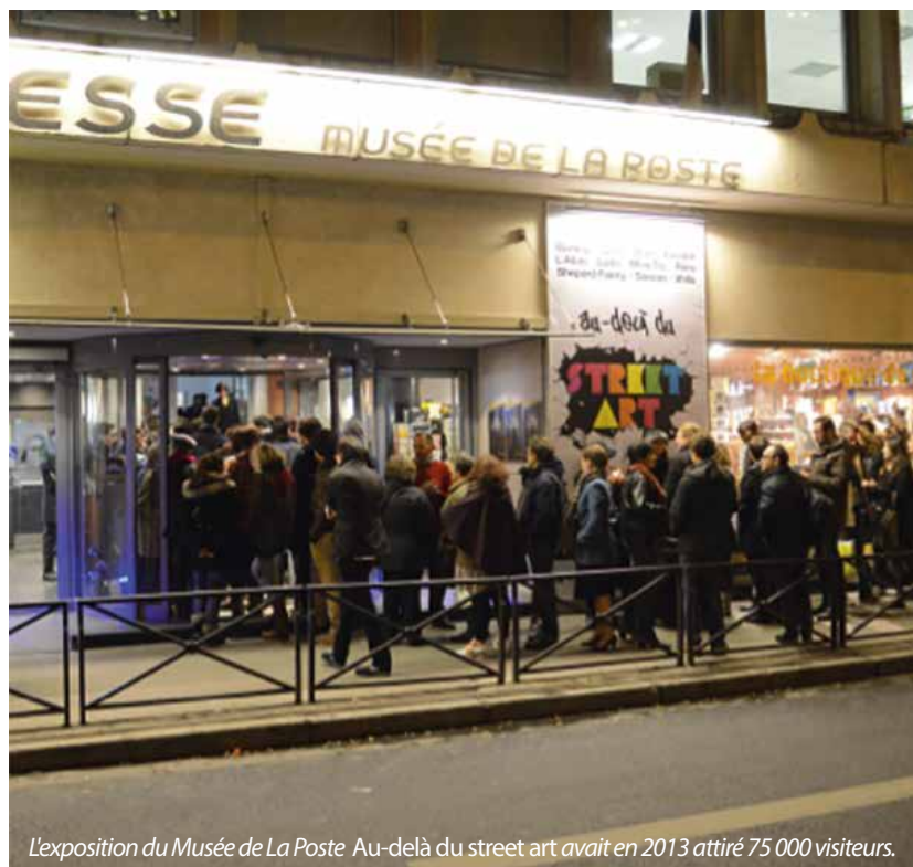
L'exposition du Musée de La Poste Au-delà du street art avait en 2013 attiré 75 000 visiteurs.

http://www.laposteauxchevaux.com/La_Poste_aux_Chevaux/Festivals.html