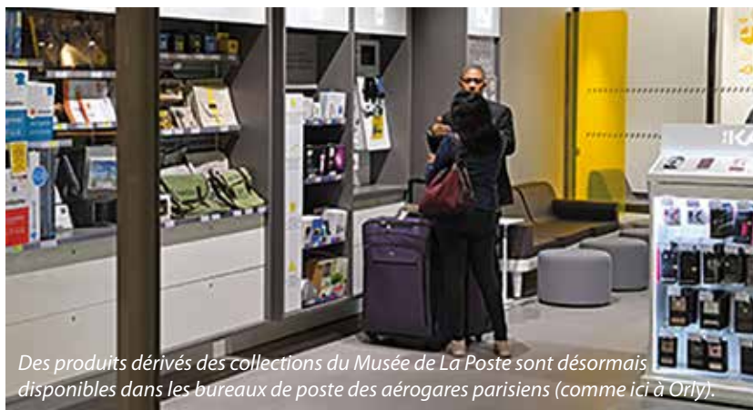
Des produits dérivés des collections du Musée de La Poste sont désormais disponibles dans les bureaux de poste des aéroports parisiens (comme ici à Orly).

Au-delà de sa boutique, c'est aussi via des points de vente hors les murs que le Musée de La Poste diffuse ses articles dérivés des collections.