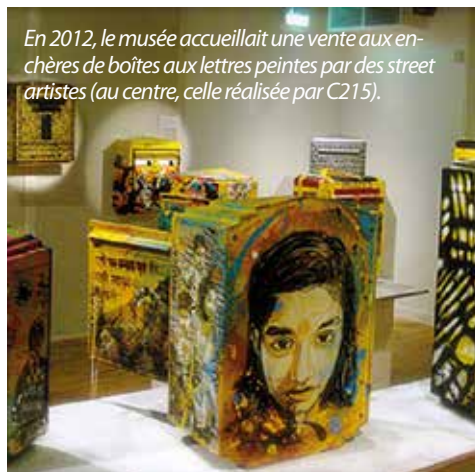
En 2012, le musée accueillait une vente aux enchères de boîtes aux lettres peintes par des street artistes (au centre, celle réalisée par C215).

Succès exceptionnel (les trottoirs du boulevard de Vaugirard se souviennent encore des files de jeunes