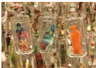
"Mur invisible", détail © Josette Rispaal

Et du Petit Robert : « De la formule latine ex voto suscepto , suivant le vœu fait. Tableau, objet symbolique, plaque portant une formule de reconnaissance, que l'on place dans une église, une chapelle, en accomplissement d'un vœu ou en remerciement d'une grâce. »