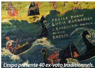
L'expo présente 40 ex-voto traditionnels.

novembre au Musée Jean Moulin. Les pièces présentées seront issues des collections du Musée Jean Moulin ainsi que du Musée de La Poste, partenaire de l'événement. Une partie du panorama des timbres français du Musée de La Poste figurera également dans l'exposition. « Mémoires gravées », du 12 mars au 8 novembre 2015, Musée Jean Moulin, 23 allée de la 2 ème Division Blindée, Paris 15 ème .