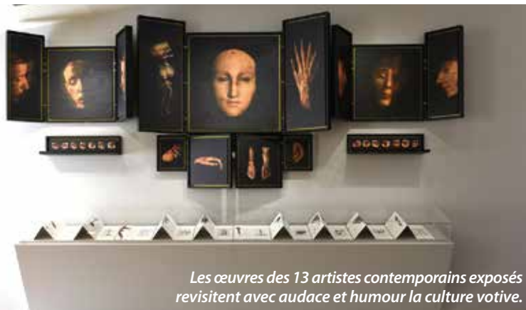
Les œuvres des 13 artistes contemporains exposés revisitent avec audace et humour la culture votive.