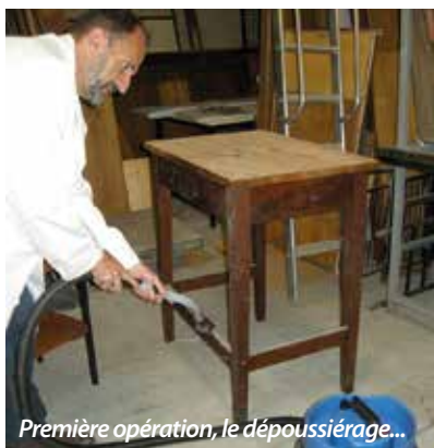
Première opération, le dépoussiérage...

Les chantiers de collection se succèdent : après ceux des "petits formats" et des poinçons philatéliques, celui du mobilier fait aujourd'hui l'objet de toutes les attentions des équipes du Musée de La Poste.