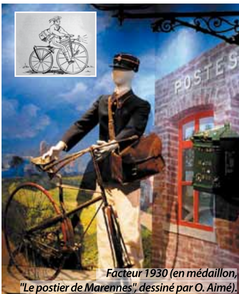
Facteur 1930 (en médaillon, "Le postier de Marennes", dessiné par O. Aimé).