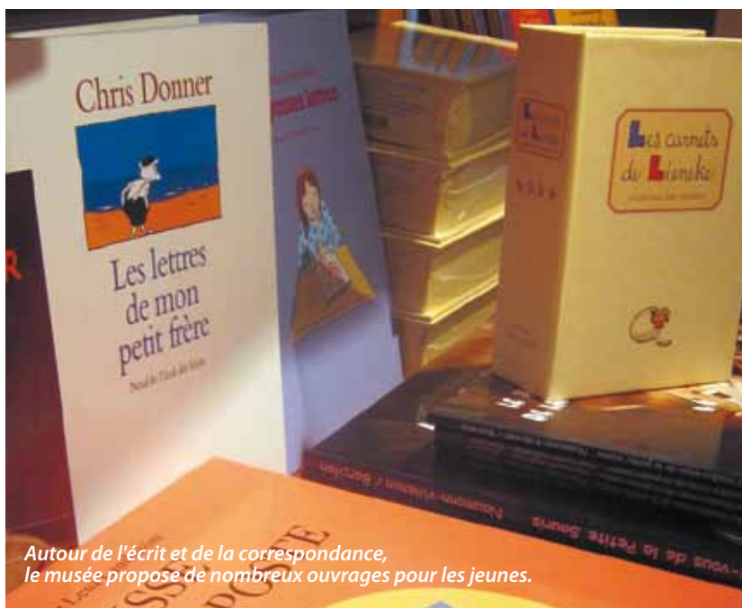
Autour de l'écrit et de la correspondance, le musée propose de nombreux ouvrages pour les jeunes.

La boutique du musée propose une large sélection de livres pour la jeunesse. Des œuvres souvent fortes et empreintes d'émotion.