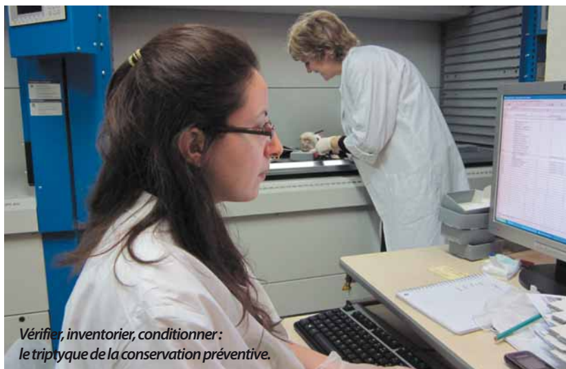
Vérifier, inventorier, conditionner : le triptyque de la conservation préventive.

Pour préserver son patrimoine, la conservation préventive reste la priorité de l'Adresse Musée de La Poste. Exemple avec le chantier des poinçons actuellement en cours.