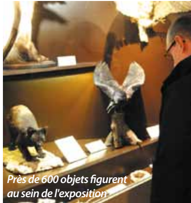
Près de 600 objets figurent au sein de l'exposition