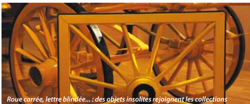
Roue carrée, lettre blindée... : des objets insolites rejoignent les collections