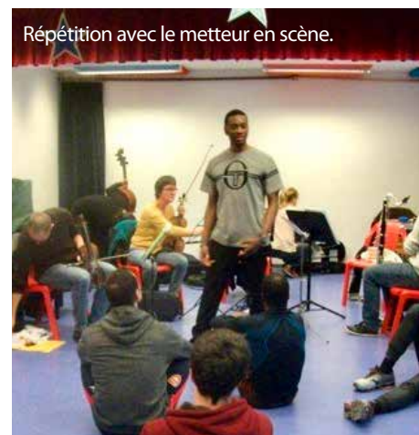
Répétition avec le metteur en scène.