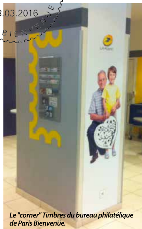
Le "corner" Timbres du bureau philatélique de Paris Bienvenue.