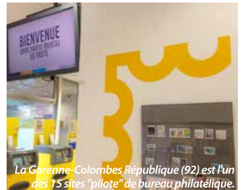
La Garenne-Colombes République (92) est l'un des 15 sites "pilote" de bureau philatélique.

Gilles Livchitz : Je voudrais aussi par ailleurs revenir sur un point : des philatélistes, que nous avons rencontrés sur