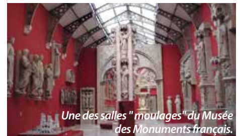
Une des salles "moulages" du Musée des Monuments français.

Un livret conçu en commun permettra aussi d'en savoir plus, sur les constructions comme sur les timbres (le Musée de La Poste intégrera dans ce document des pièces issues de ses archives philatéliques). Ce livret, réalisé avec le soutien de l'Adphile, sera remis gratuitement aux visiteurs.