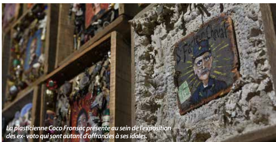
La plasticienne Coco Fonsac présente au sein de l'exposition des ex-voto qui sont autant d'offrandes à ses idoles.

Il avait donné un aperçu conséquent de ce savoir-faire spécifique - des centaines de timbres détournés et réinventés - lors d'une exposition de ses travaux que le musée avait proposée en 2008. Dans le nouvel ac-