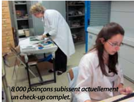
8 000 poinçons subissent actuellement un check-up complet.