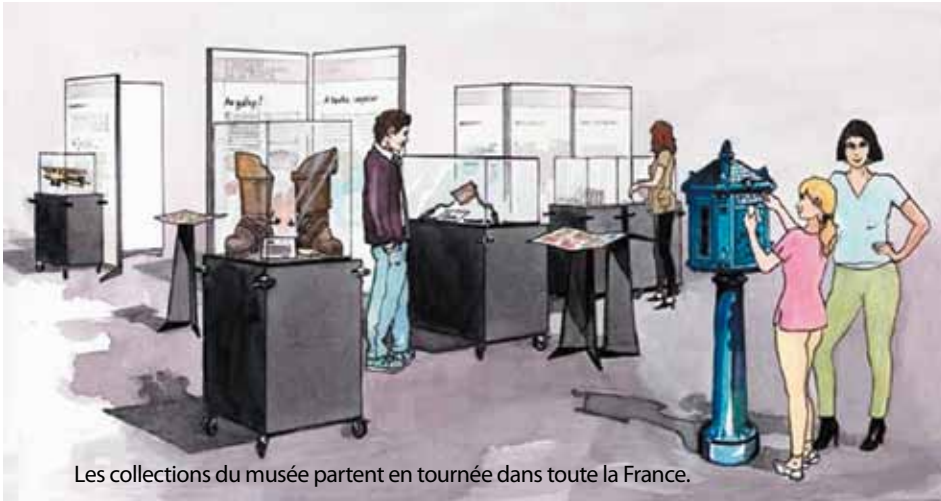
Les collections du musée partent en tournée dans toute la France.

- une quinzaine par série en moyenne - et fournit au demandeur un DVD. A lui ensuite de les faire imprimer et de les implanter sur le lieu d'exposition. En attendant leur réinstallation dans des salles rénovées, deux belles façons de continuer à profiter des collections du musée. ■