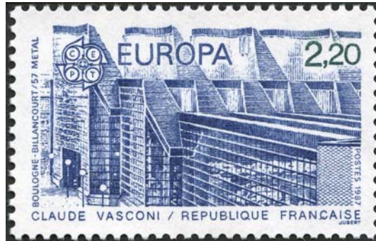
Boulogne-Billancourt, Atelier 57 Métal - Timbre-poste émis le 27 avril 1987. Dessiné et gravé par Jacques Jubert. Impression en taille-douce. Série Europa sur le thème « Architecture moderne »

Enfin, des événements à destination des différents publics seront programmés.