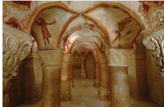
Tavant, église Saint-Nicolas, crypte. Copie à grandeur par Marthe Flandrin et Simone Flandrin-Latron, 1941