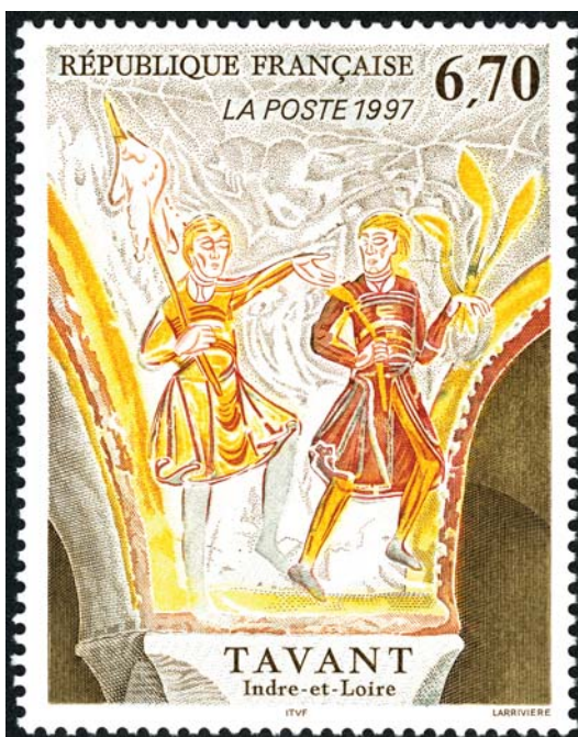
Timbre-poste émis le 3 mars 1997, dessiné par Odette Baillais, gravé par Jacky Larrivière Impression en taille-douce. Série artistique © Coll. L'Adresse Musée de La Poste / La Poste / DR

Le parcours Archi-timbrée, en partenariat avec l'Adresse Musée de La Poste, propose une mise en regard de timbres représentant des chefs-d'œuvre du patrimoine architectural français et les œuvres qu'ils représentent. Ces œuvres se trouvent en grandeur nature au sein des collections de la Cité de l'architecture & du patrimoine.