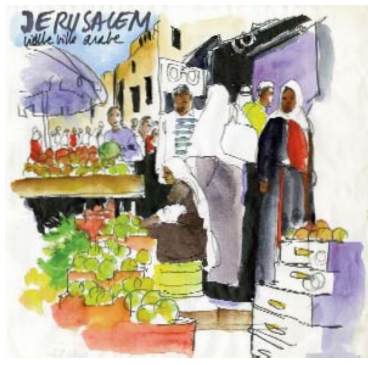
Israel-Palestine Yann Le Béhec