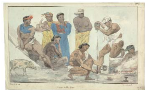
Voyage autour du monde sur la corvette « La Coquille » dessin de J. L. Le Jeune 1822-23