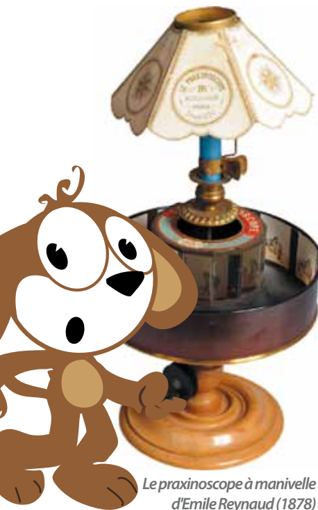
Le praxinoscope à manivelle d'Emile Reynaud (1878)

(le scénario en images), la mise sur calque, la bande-son... On peut aussi s'asseoir et regarder un épisode.