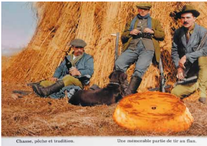
Chasse, pêche et tradition.

Un collector Plonk & Replonk est en cours de réalisation. Il sera disponible prochainement à la boutique et à l'espace Timbres du musée. Tout comme le catalogue, actuellement en préparation, des objets et photos installés dans les collections par les deux artistes suisses.