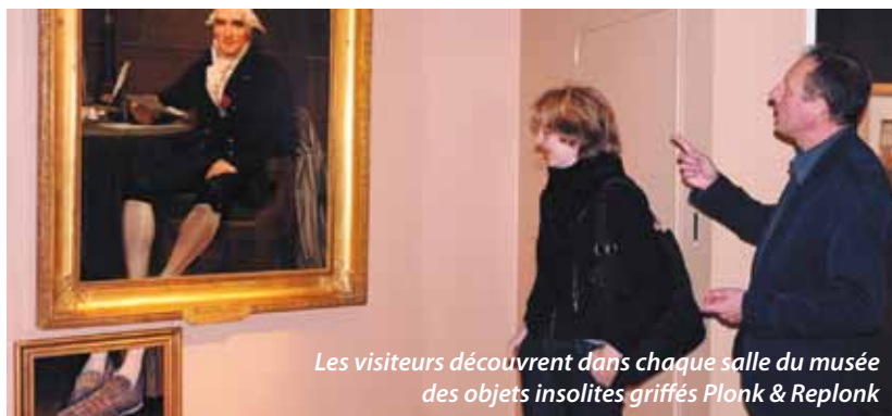
Les visiteurs découvrent dans chaque salle du musée des objets insolites griffés Plonk & Replonk

De drôles d'objets ont rejoint les collections. La première surprise passée, les visiteurs apprécient. Témoignages.